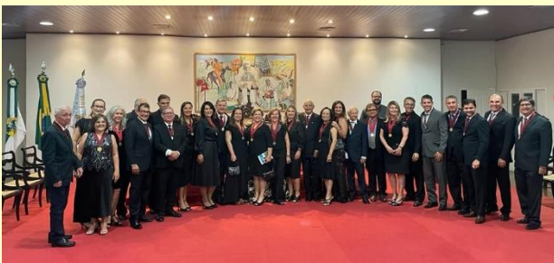
Antigos e novos Acadêmicos em confraternização geral.